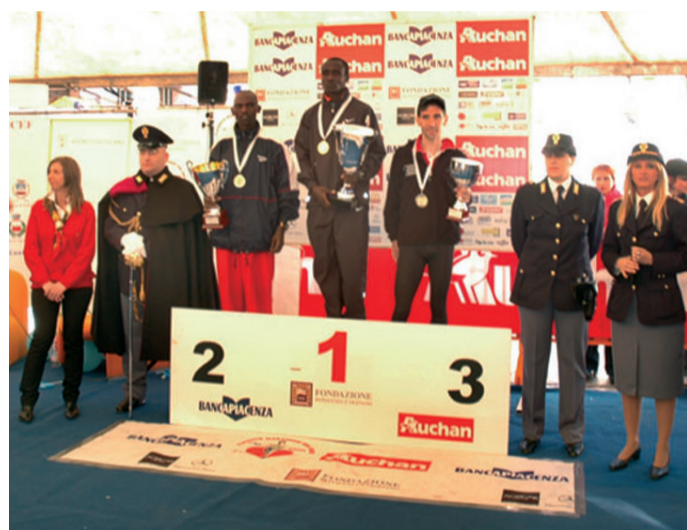
Nelle foto di Carlo Mistraretti, il podio dei vincitori dell'edizione 2008 della Placentia Marathon.

La cifra necessaria per il mantenimento in opera del centro è di circa 150.000 euro.