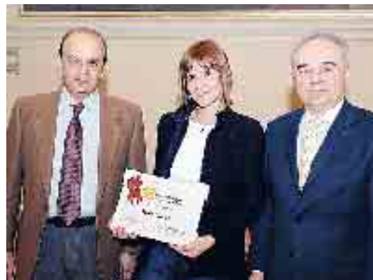
La consegna della targa premio a uno dei partner commerciali della Placentina Marathon 2011

to sommerso dalle risposte. Invece ho scoperto un'amara verità: le aziende che hanno risposto sono poche, nonostante la maratona convogli su Piacenza migliaia di persone, tra atleti e familiari. È un vero peccato: non sono state capite le potenzialità che un evento del genere può portare per il territorio. Del resto, lo si è visto anche dal questionario on line che hanno compilato i partecipanti alla Placentina Marathon. Dicevano di voler tornare a Piacenza e nella sua provincia ma, di fatto, non abbiamo visto i numeri previsti secondo le risposte. Abbiamo pensato che fosse un problema di strutture ricettive ed eccoci qua a sviluppare questo aspetto. Ma chi ha un'attività deve essere il primo a volerlo. Un esempio eloquente è